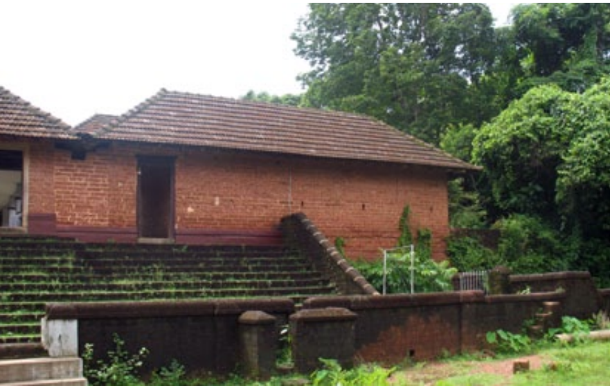
^ കുമാരയക്കുട്ട് ചേർത്ത് നിർമ്മിച്ച കെട്ടിടം.